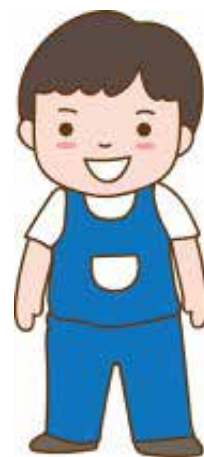
เจ้าใจน้องกับต้น