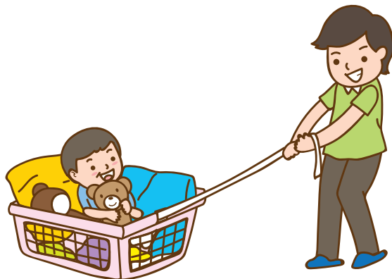
นั่งเรื่อลาก

เล่นสนุกเยอะๆ ให้ลูกมีเสียงหัวเราะทุกวัน เด็กๆชอบการเล่นแบบเคลื่อนไหว เช่น เล่นเครื่องบิน นั่งโยกแยกบนตัวพ่อ แกว่งเป็นนาฬิกา จักกะจี้ วิ่งไล่จับ ลากผ้าห่ม ปาหมอน