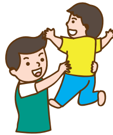
นาฬิกา ตีต็อก