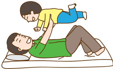
เล่นเครื่องบิน